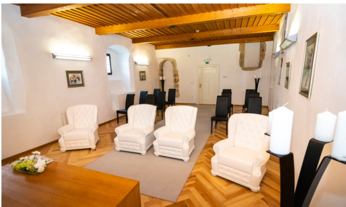
Poročna dvorana v gradu Komenda

Občina Polzela leži ob starem cestnem križišču. Celjska kotlina se tu približa Šaleški in Zgornji Savinjski dolini. Ti kraji rodovitnih polj in osončenih gričev so bili že zgodaj poseljeni. Mark Avrelij je v 2. stoletju, v času bojev Rimljanov proti Germanom, v Ločici ob Savinji zgradil močan tabor II. italške legije, kjer je bila nameščena za tiste čase ogromna vojska okrog 5000 vojakov. Dolga stoletja so območju zgodovino pisali Malteški vitezi, pa tudi Celjski grofje in Dominikanci.