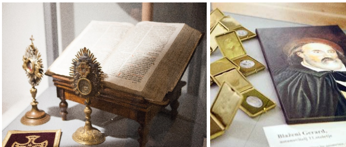
Razstavni eksponati Suverena malteškega viteškega reda z mašno knjigo iz leta 1666

Osrednja znamenitost Občine Polzela je grad Komenda , nekoč strateško pomembna stavba rodbine polzelskih plemičev Helensteinov, ki se prvič omenja že leta 1149. V 13. stoletju je za pol tisočletja prešel v roke Malteškega viteškega reda, ki je s svojim poslanstvom (obramba vere in pomoč ubogim) bistveno vplival na življenje ljudi v kraju.