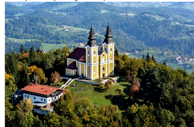
Gora Oljka s cerkvijo svetega Križa in planinskim domom

Z dediščino Malteškega viteškega reda sta povezani tudi farna cerkev svete Marjete z dragoceno relikvijo svetega Teodorja in cerkev svetega Križa na Gori Oljki zgrajena v baročnem slogu z veličastnim oltarjem, ki prikazuje Jezusa in apostole pri zadnji večerji. Posebnost cerkve je podzemno svetišče z Božjim grobom in dvema stranskima oltarjema. Gora Oljka s kakovostno ponudbo hrane v planinskem domu in razgledom na Savinjsko dolino pritegne tako izletnike kot številne rekreativce. Z urejenega parkirišča traja vzpon do vrha 40 minut.