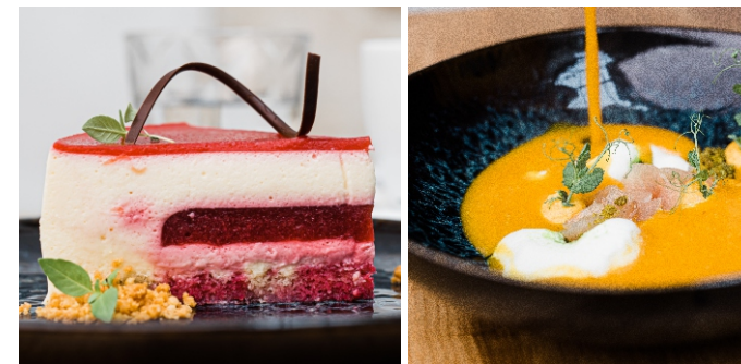
Bistro Pasijonka, kavarna in slaščičarna

Kavarna in slaščičarna Bistro Pasijonka v pritličju gradu nudi kulinarično razvajanje za skupine po dogovoru ali samo postanek ob kavi in okusni domači tortici v grajskem ambientu.