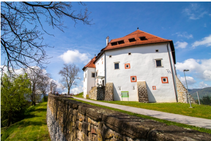
Grad Komenda na vzpetini v središču Polzele

Občina Polzela leži ob starem cestnem križišču. Celjska kotlina se tu približa Šaleški in Zgornji Savinjski dolini. Ti kraji rodovitnih polj in osončenih gričev so bili že zgodaj poseljeni. Mark Avrelij je v 2. stoletju, v času bojev Rimljanov proti Germanom, v Ločici ob Savinji zgradil močan tabor II. italške legije, kjer je bila nameščena za tiste čase ogromna vojska okrog 5000 vojakov. Dolga stoletja so območju zgodovino pisali Malteški vitezi, pa tudi Celjski grofje in Dominikanci.